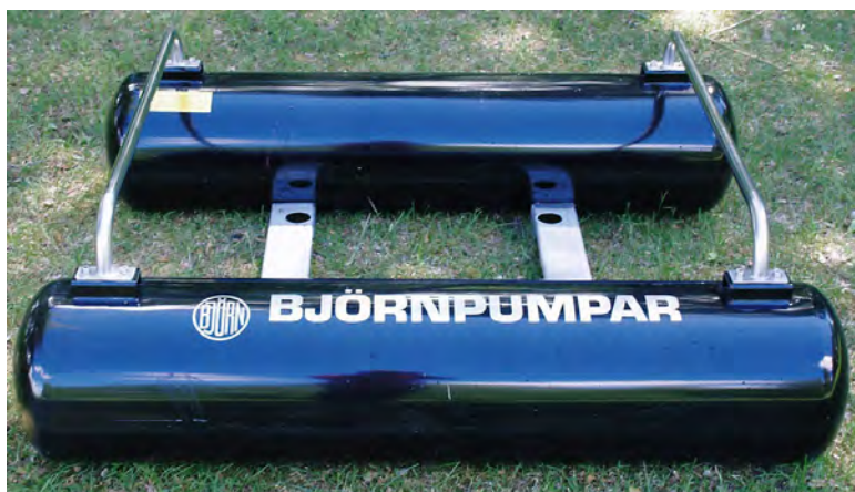
PONTONBRYGGA FB-70 ARTNR: 2-07