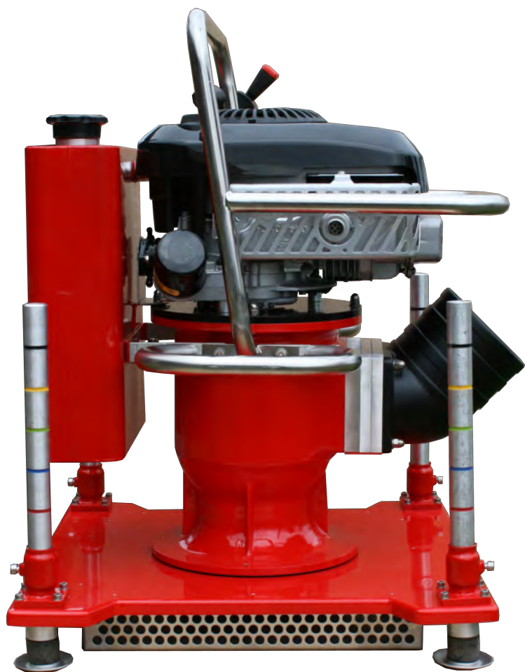
STT-70 ARTNR: 1-07

STT-70 GÖRS ENKELT FLYTBAR MED PONTONBRYGGA FB-70