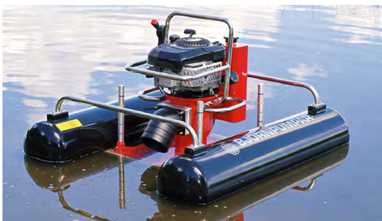
STT-70 monterad med Pontonbrygga FB-70

BJÖRN® TYP STT-70 är konstruerad för effektiv katastrofberedskap och krävande tillämpningar inom räddningstjänsten, brandkåren och marinen.